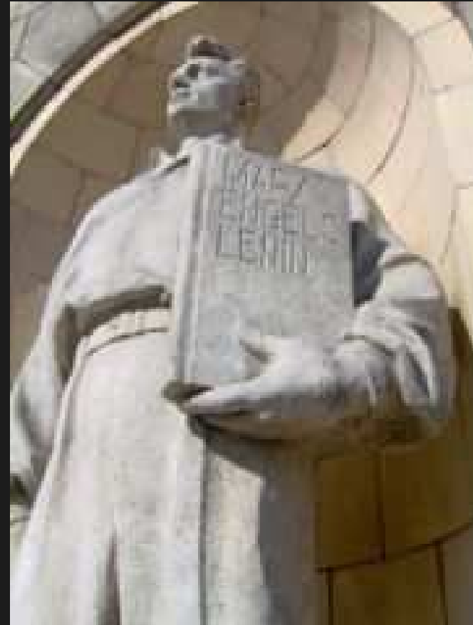
Skulptuur Warssavi raekojal