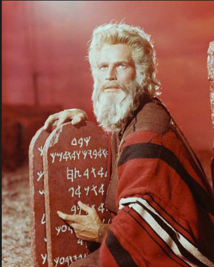
Ten Commandments (Cecil B. DeMill 1956, Paramount Pictures)